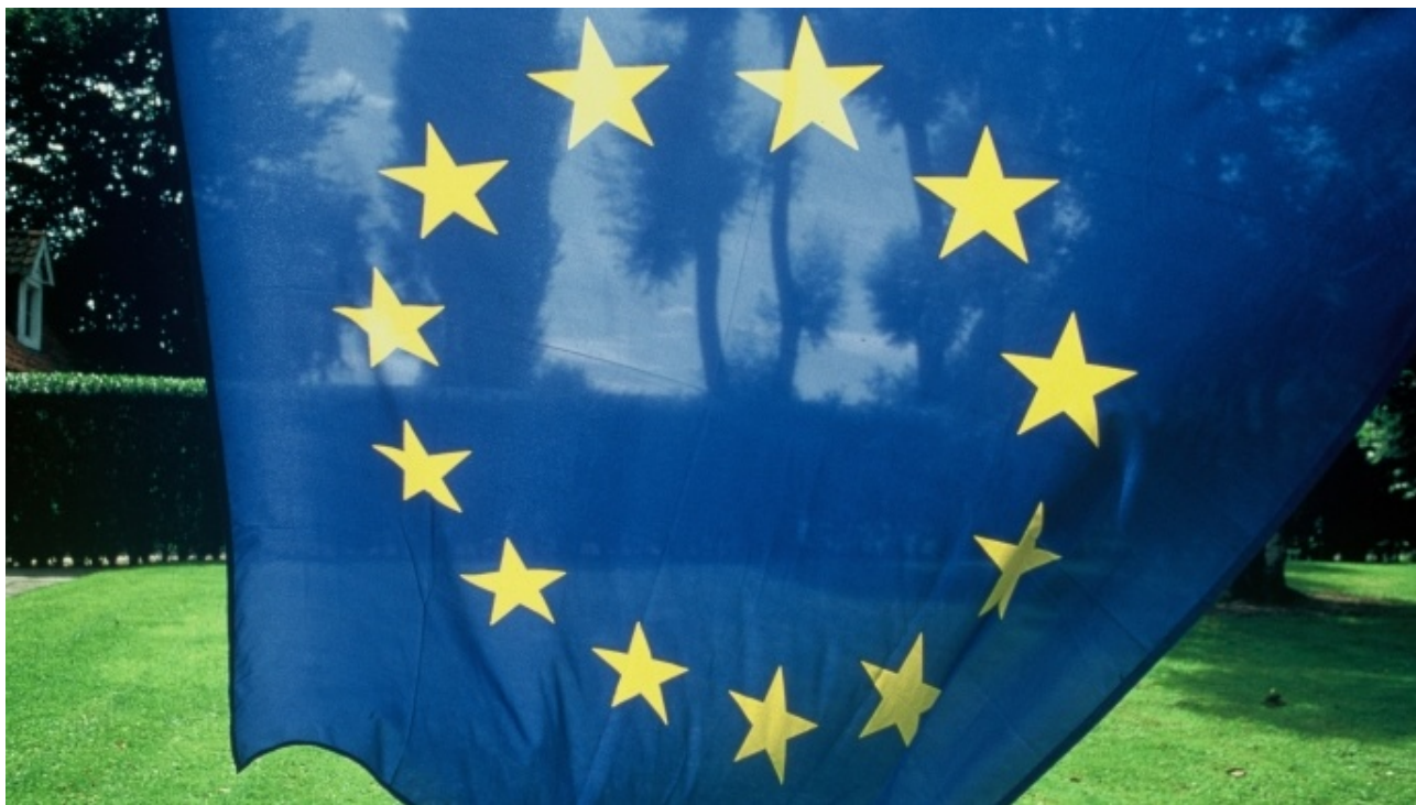
Au sein de la population française, les agriculteurs seront parmi les plus assidus à se rendre aux urnes le 25 mai prochain pour les élections européennes.

Selon le baromètre agricole Terre-net Bva, 43 % des agriculteurs sont favorables à une renationalisation de la Politique agricole autrement dit à la fin de la Pac. 88 % iront voter aux élections européennes du 25 mai.