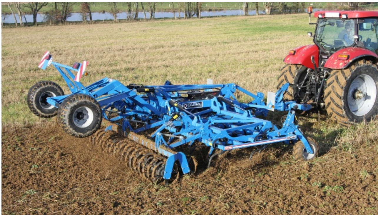
Le déchaumeur Penterra est équipé de 5 rangées de dents avec un espace inter-dents de 125 à 175 mm.

Avec une toute nouvelle gamme de déchaumeurs à dents de 3 à 12 m et un robot autonome (citation aux Sima Innovation Awards), il y aura des choses à voir sur le stand du Français au Sima 2015 !