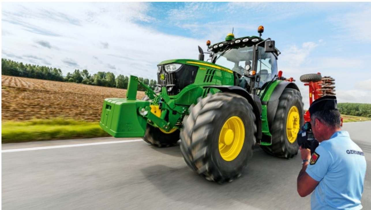
Sur la route, il y a des règles.

Hauteur, largeur, longueur, masse, permis, immatriculations, ... Bienvenue dans la jungle du code de la route qui s'applique aussi aux engins agricoles, avec certaines spécificités en plus. Le point pour vous y retrouver. Article déjà publié le 9 février 2016, mis à jour pour reparation le 27 juin 2018.