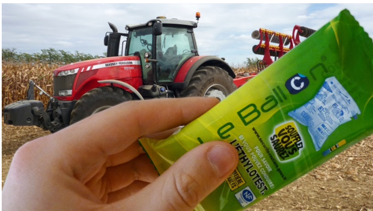
Même en tracteur, la présence d'un éthylotest à bord est obligatoire.

Pour le code de la route, le triangle est obligatoire, le gilet jaune seulement conseillé. Prudence ! Le code du travail, qui doit aussi être respecté dès qu'il existe des utilisateurs autres que le patron, oblige à donner les équipements de protection individuelle (EPI) adéquats. Donc pour les chauffeurs, même les adhérents d'une Cuma, il faut un moyen de sécurisation en abord de circulation, donc un gilet de haute visibilité. L'extincteur n'est pas obligatoire mais recommandé lors de certains travaux (transport de fourrage par exemple). Enfin, un éthylotest doit être présent dans la cabine du tracteur. Le cas échéant, vous ne risquez rien. Un décret du 28 février 2013 annule l'amende de 11 € initialement prévue.