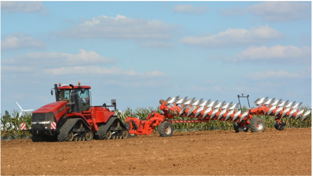
Les convois de plus de 25 m de long sont considérés convoi exceptionnel.

Au-delà de 4,5 m de large et/ou de 25 m de long, votre convoi est considéré comme exceptionnel. Si vous êtes dans cette situation, vous devez posséder une autorisation préfectorale et être escorté par du personnel formé, la police ou la gendarmerie.