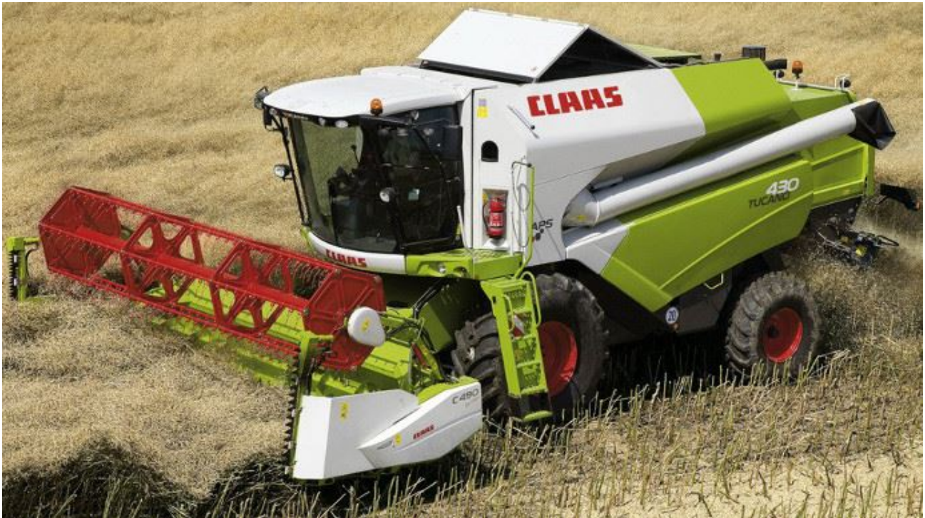
La Tucano 430 concentre les avantages des autres modèles de la marque.

La Claas Tucano 430 est apparue sur le marché français en 2008. Présentation de cette moissonneuse batteuse dans cette fiche occasion extraite de Terre-net Magazine n°62.