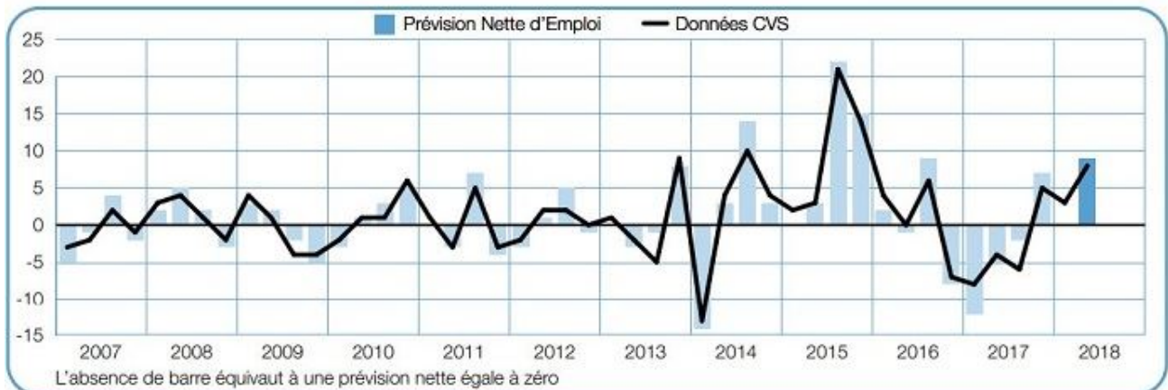
Evolution des perspectives d'emploi dans le secteur agricole (@ManpowerGroup)

Les perspectives d'embauche les plus importantes depuis deux ans sont attendues au trimestre prochain. Les employeurs rapportent une Prévision Nette d'Emploi de +8%, soit une augmentation de 4 points par rapport au trimestre précédent, et de 14 points par rapport au deuxième trimestre de 2017.