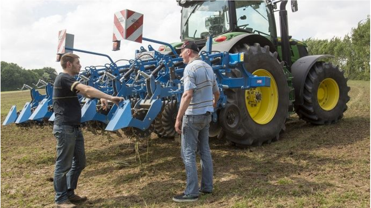
Depuis le début de l'année 2017, les perspectives d'emploi dans le secteur agricole sont en nette progression, selon le groupe Manpower.

Selon ManpowerGroup, qui publie chaque trimestre un baromètre des perspectives d'emploi, c'est dans le secteur agricole que les perspectives d'embauche progressent le plus en France (+ 8 %), et ce, pour le deuxième trimestre consécutif.