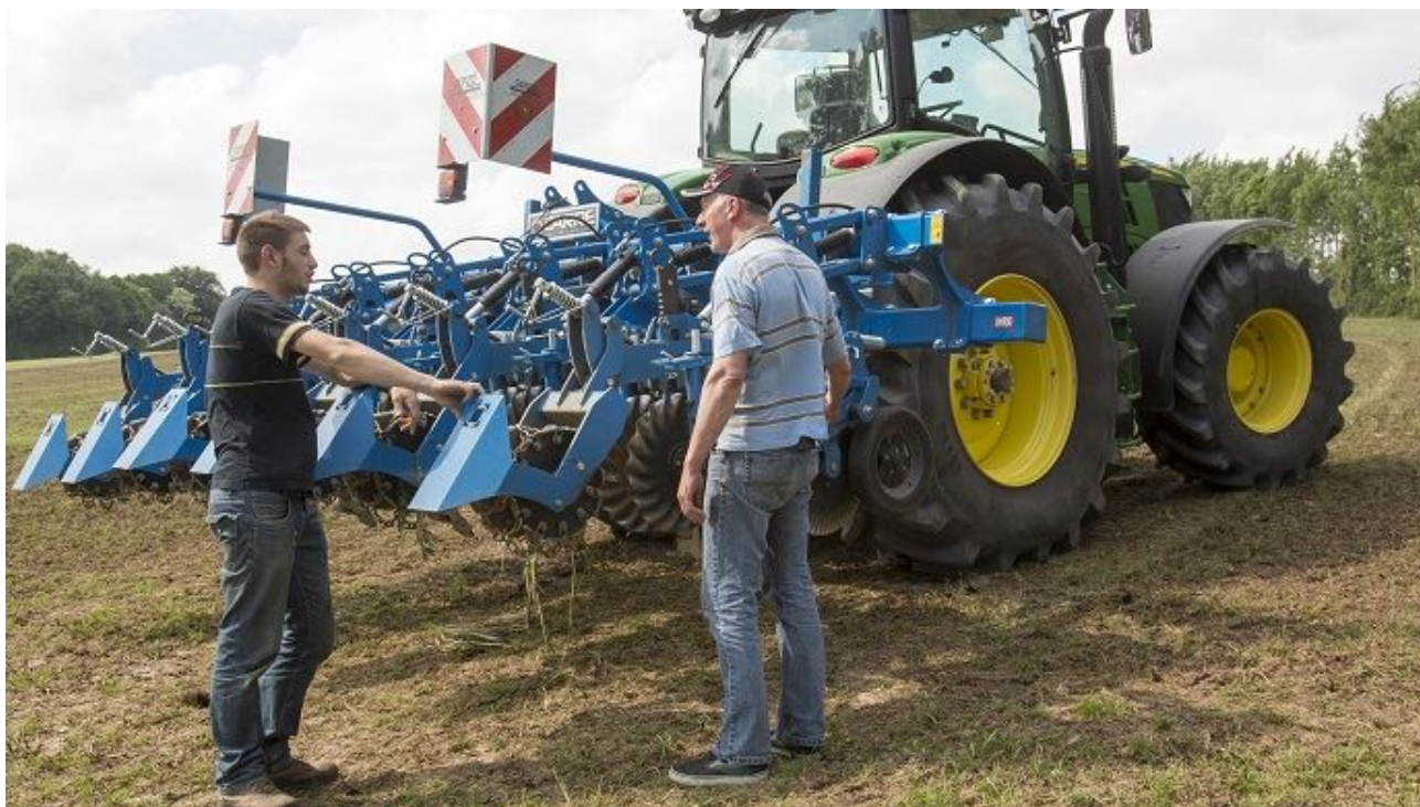
Depuis le début de l'année 2017, les perspectives d'emploi dans le secteur agricole sont en nette progression, selon le groupe Manpower.

Selon ManpowerGroup, qui publie chaque trimestre un baromètre des perspectives d'emploi, c'est dans le secteur agricole que les perspectives d'embauche progressent le plus en France (+ 8 %), et ce, pour le deuxième trimestre consécutif.