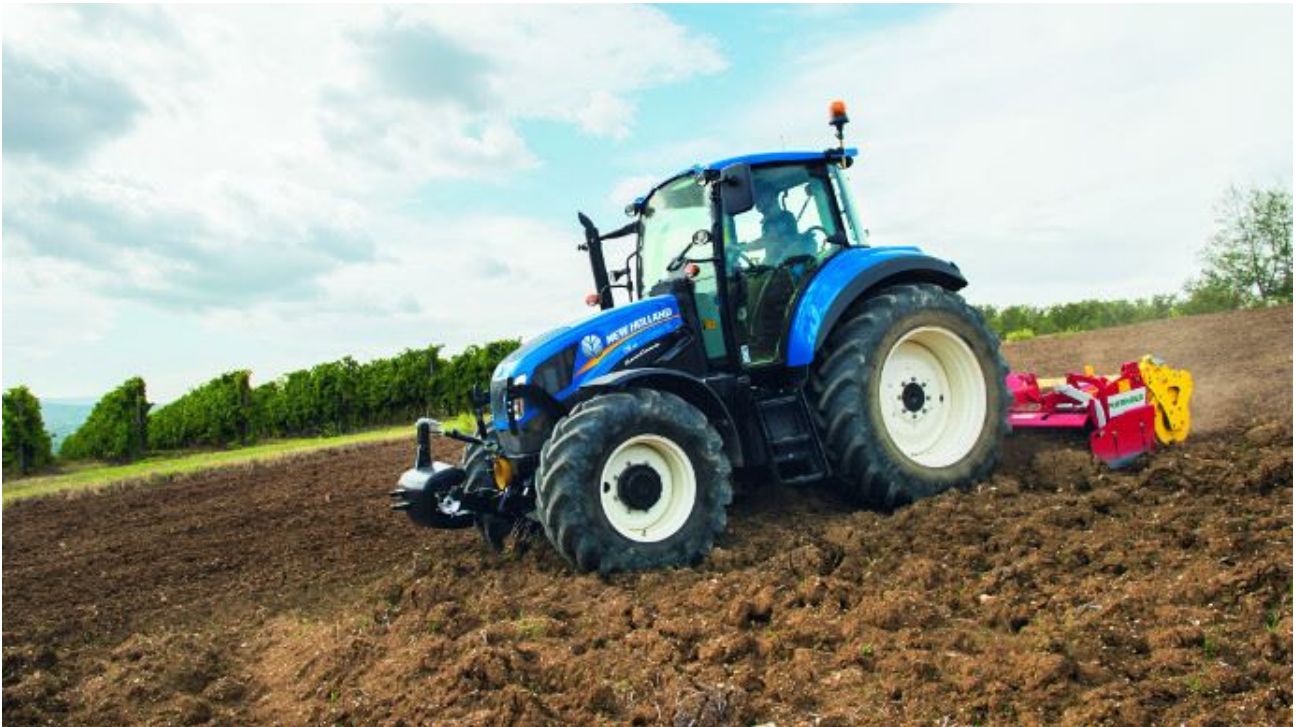
La cabine VisionView a été conçue autour de l'opérateur grâce à des simulations de réalité virtuelle.

Le New Holland T5.95 est apparu sur le marché français en 2012. Présentation de ce tracteur dans cette fiche occasion extraite de Terre-net Magazine n°70.