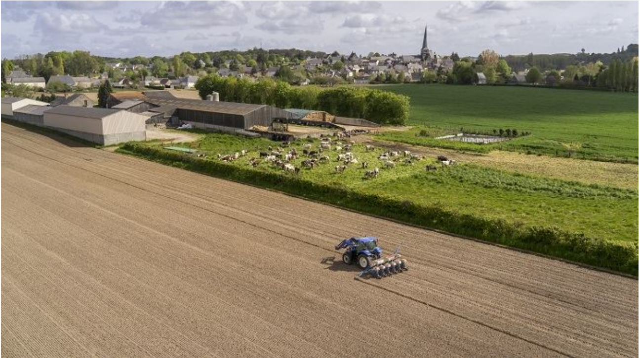
Entre 2010 et 2016, le nombre d'exploitations agricoles a diminué de 11 %.

Entre 2010 et 2016, le nombre d'exploitations agricoles en France a continué de baisser, mais à un rythme moins élevé que lors de la précédente décennie, selon Agreste. La baisse est cependant beaucoup plus marquée dans les filières d'élevage.