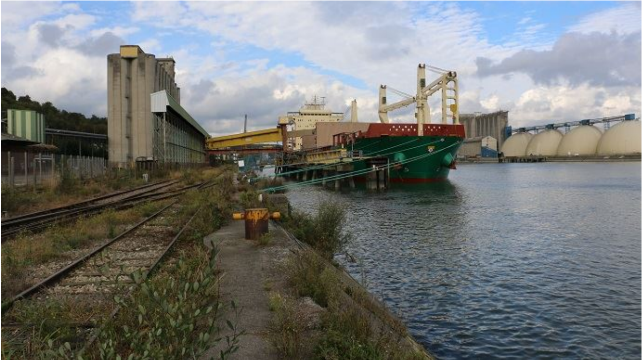
En juillet et août, la France a multiplié par 8 ses exportations d'orge vers la Chine, témoignant du bon démarrage de la campagne d'exportation 2018-2019 des céréales françaises.

Au cours des seuls mois de juillet et août, la Russie avait déjà vendu à l'export 10,6 Mt de ses céréales, soit 26 % de ses possibilités pour 2018-2019. La France n'est pas en reste, en réalisant un bon début de commercialisation vers pays tiers.