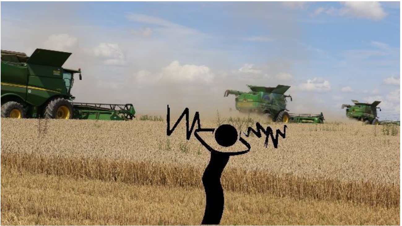
Avons-nous le droit de faire plus de bruit qu'une "rave party" ?

5 Pour la cinquième place, c'est un article sur une nouvelle marque de tracteurs qui arrive en Europe : « Le premier fabricant de tracteurs au monde est indien et s'installe en Europe ».