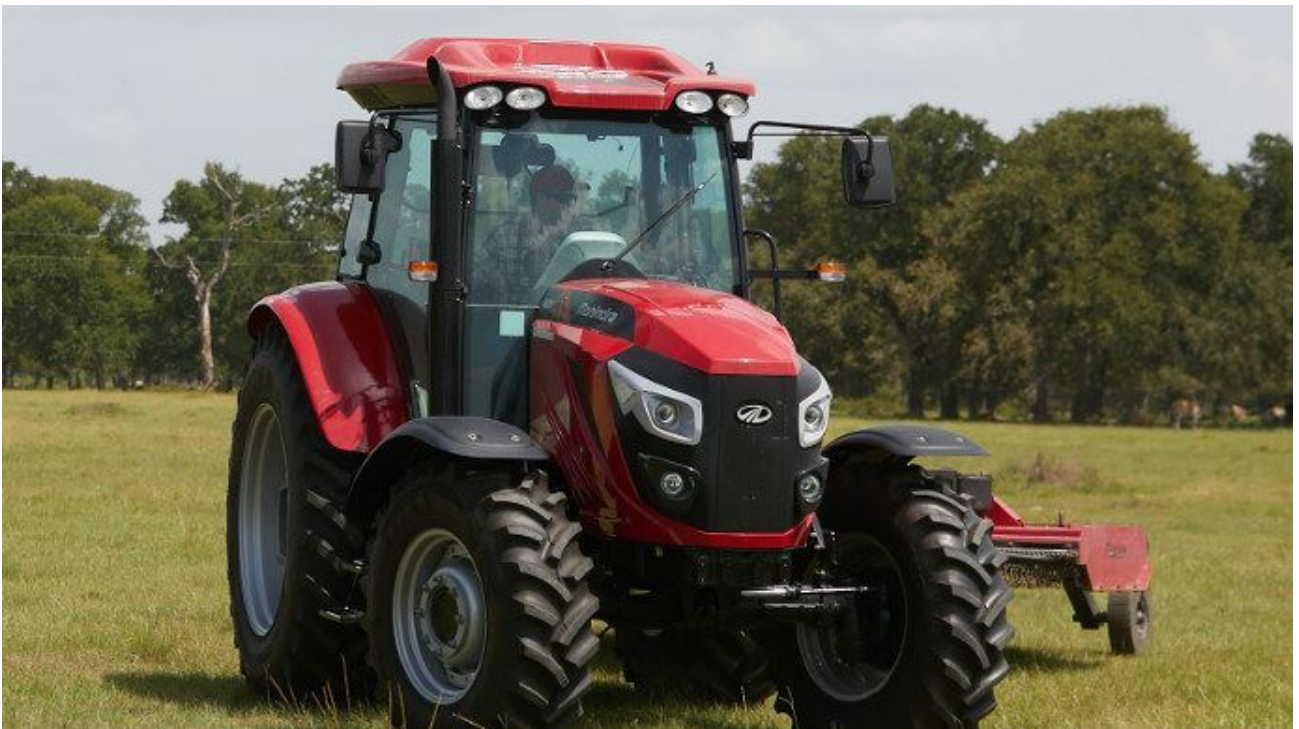
Mahindra va-t-il progresser en Europe ?

5 Pour la cinquième place, c'est un article sur une nouvelle marque de tracteurs qui arrive en Europe : « Le premier fabricant de tracteurs au monde est indien et s'installe en Europe ».