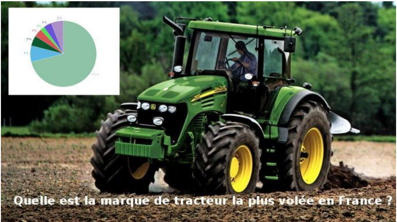
C'est John Deere qui remporte la palme d'or. Les tracteurs de cette marque sont très demandés.

3 Toujours plus de vois dans les exploitations agricoles . C'est certainement ce qui place l'article « Quelle est la marque de tracteur la plus volée en France ? » à la troisième place du classement.