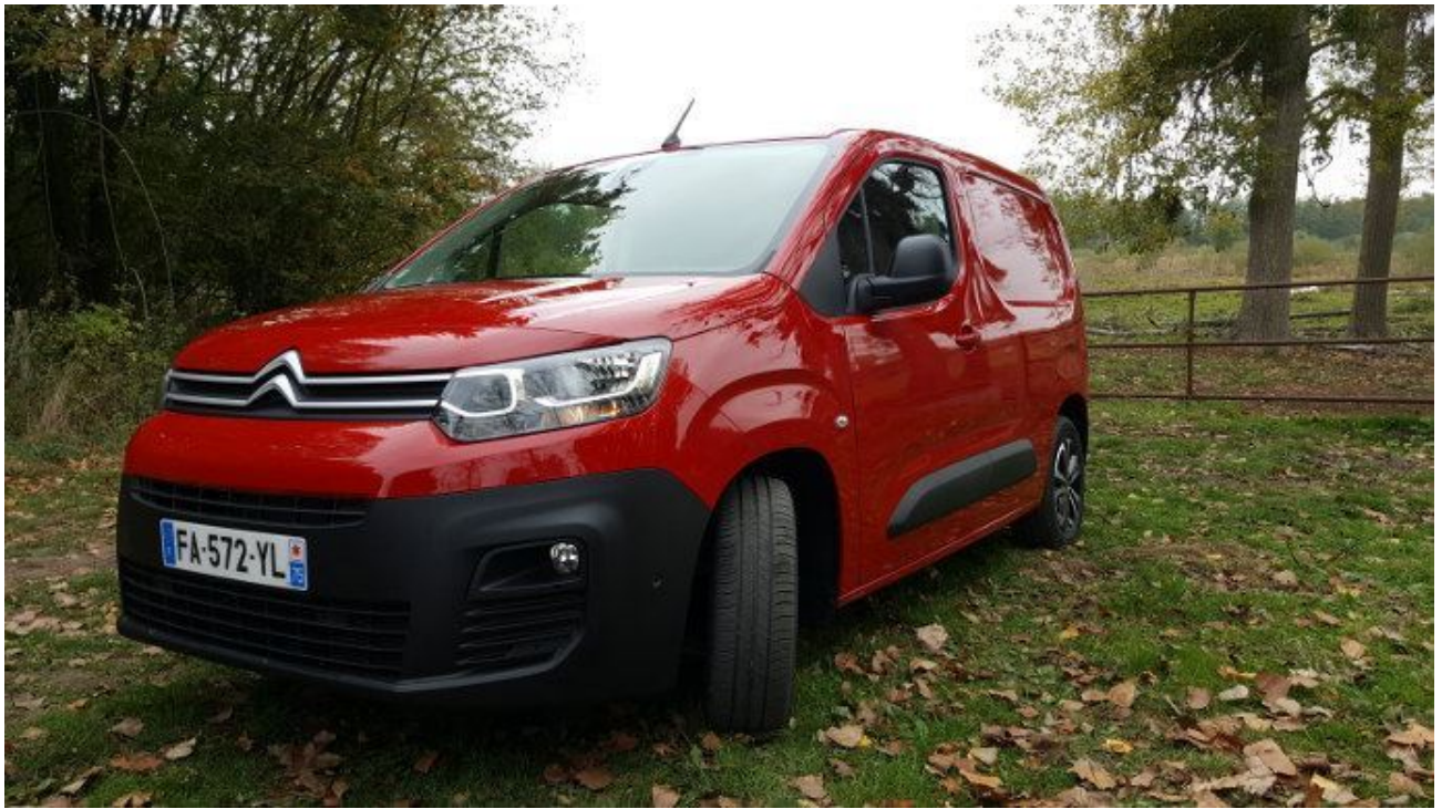
Le Berlingo Van remplacera-t-il le C15 de Citroën ?

3 Toujours plus de vois dans les exploitations agricoles . C'est certainement ce qui place l'article « Quelle est la marque de tracteur la plus volée en France ? » à la troisième place du classement.