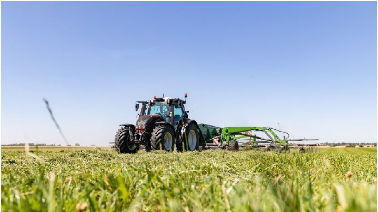
La série N de Valtra répondant aux exigences Stage V profite également de la suspension pneumatique Aires.

Valtra propose désormais sa suspension pneumatique Aires, plus rapide et efficace que la version hydropneumatique, sur la série N. Plus l'essieu avant est chargé, plus le système durcit et compense les à-coups. Seule condition : bénéficier d'un compresseur d'air sur l'engin !