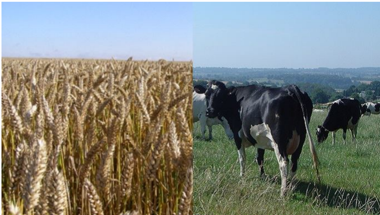
De décembre 2017 à décembre 2018, le prix du blé tendre a grimpé de + 31,9 % et celui du lait est resté stable.

Selon l'Institut national de la statistique et des études économiques (Insee), les prix agricoles à la production ont augmenté de + 5,2 % en décembre 2018 par rapport au même mois de l'année précédente. Ont surtout progressé les pommes de terres (+ 56,6 %) et les céréales (+ 26,4 %), notamment le blé tendre (+ 31,9 %). Le prix du lait, lui, est stable sur un an.