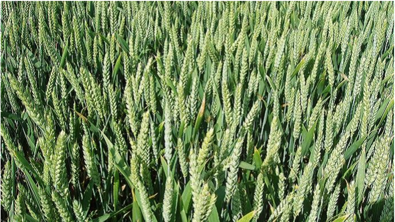
Entre janvier 2018 et 2019, le prix du blé tendre s'est apprécié de + 32,4 %.

Selon l'Institut national de la statistique et des études économiques (Insee), les prix agricoles à la production sont en hausse de + 6,1 % en janvier 2019 par rapport au même mois de l'année précédente, contre + 5,1 % en décembre dernier comparé à décembre 2017. Ont progressé principalement les pommes de terre (+ 59,5 %) et les céréales (+ 26,3 %), notamment le blé tendre (+ 32,4 %) et le maïs (+ 20,2 %). Le prix du lait, lui, est en très légère augmentation (+ 2,2 %).