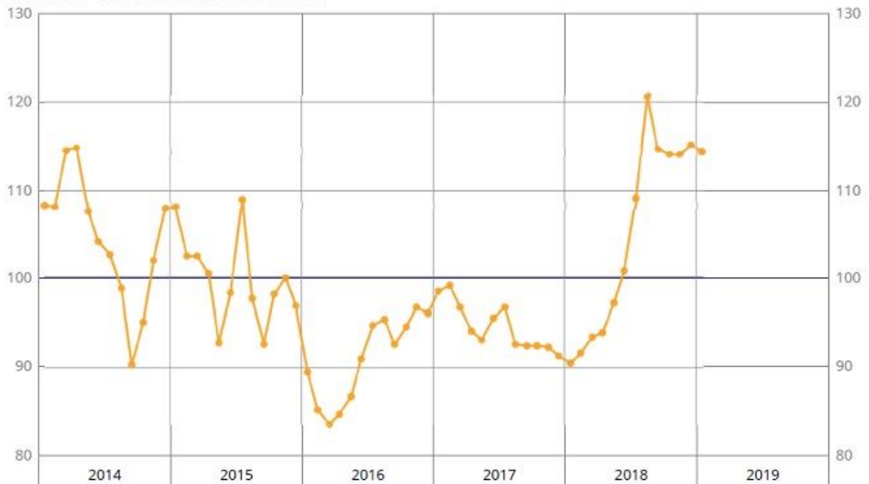
Évolution du prix à la production des céréales depuis 2014.

données CVS - base et référence 100 en 2015