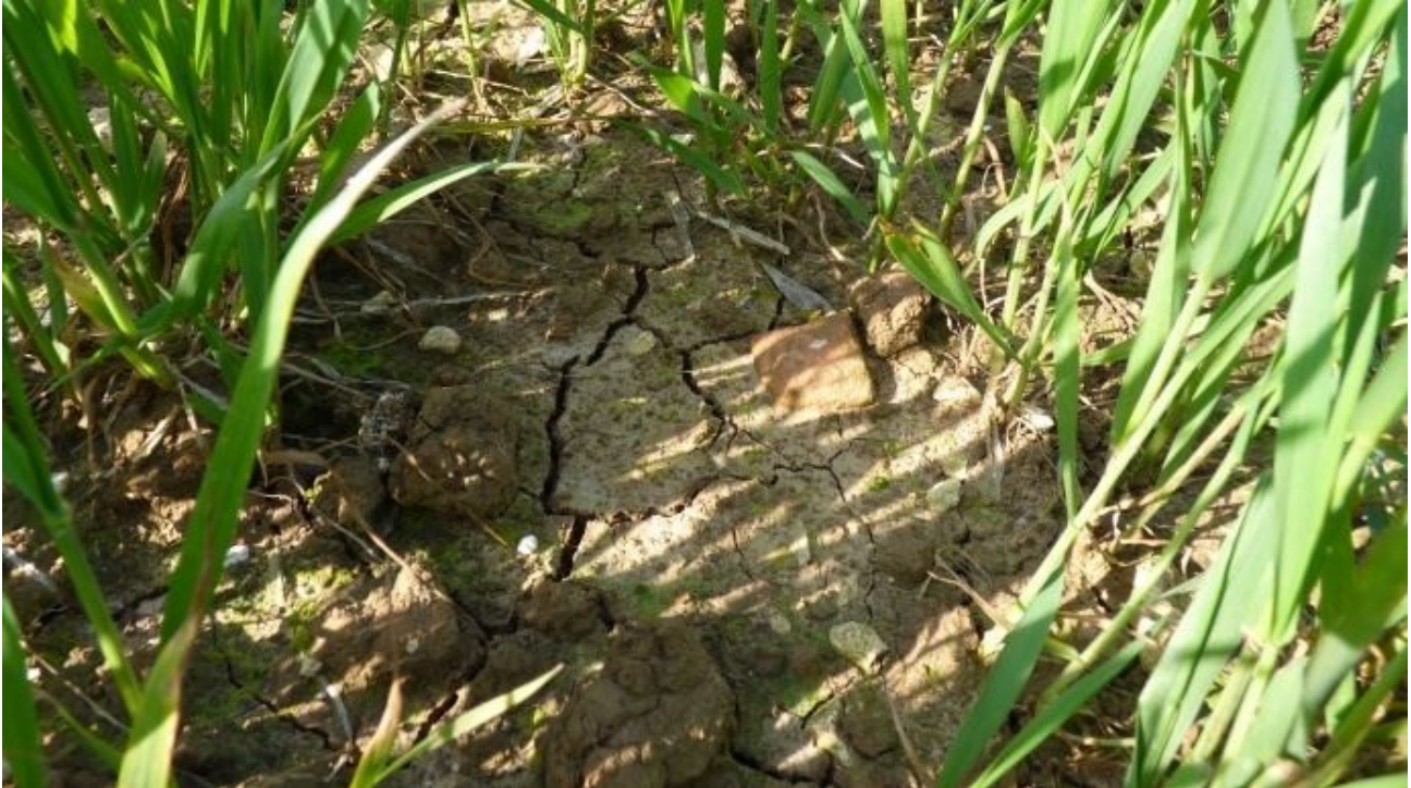
Le Nord a été placé en alerte sécheresse pour la troisième année consécutive.

Avril et déjà un arrêté pour placer le Nord en alerte sécheresse. C'est la troisième année que le département est soumis à des mesures de restrictions de l'usage de l'eau, mais la première fois aussi tôt dans l'année. Les agriculteurs ont désormais l'interdiction d'irriguer entre 11h et 17h.