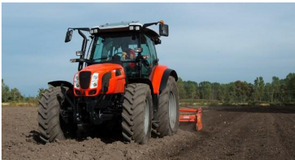
Quatre régimes prise de force sont disponibles selon les besoins : 500, 500eco, 1.000 et 1.000eco tr/min, ainsi qu'une prise de force proportionnelle à l'avancement.