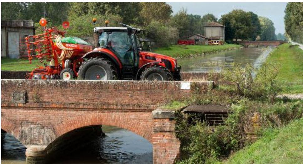
Same annonce un freinage sécurisé grâce à un système hydrostatique intégré avec des freins à disques à bain d'huile indépendants sur les 4 roues.

Les commandes sont déjà ouvertes et les premiers Virtus devraient être livrés en janvier 2013. En raison des nouveaux choix stratégiques évoqués plus haut, ce tracteur sera commercialisé exclusivement par le réseau Same. Les prix ne sont pas encore fixés, mais le constructeur annonce des tarifs agressifs. Concernant les autres marques du groupe, Lamborghini et Deutz-Fahr pourraient, à leur tour, présenter des modèles différenciés, sur ce créneau de puissance, au Sima 2013.