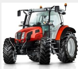
Same Virtus 120

Moteur : 4 cylindres Deutz Common Rail Stage IIIb (Tier 4 intérim )