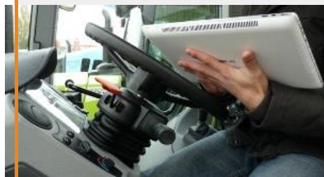
Le Sima c'est maintenant.

Retrouvez toute l'information du Sima 2013 et de l'innovation en cliquant sur les liens suivants :